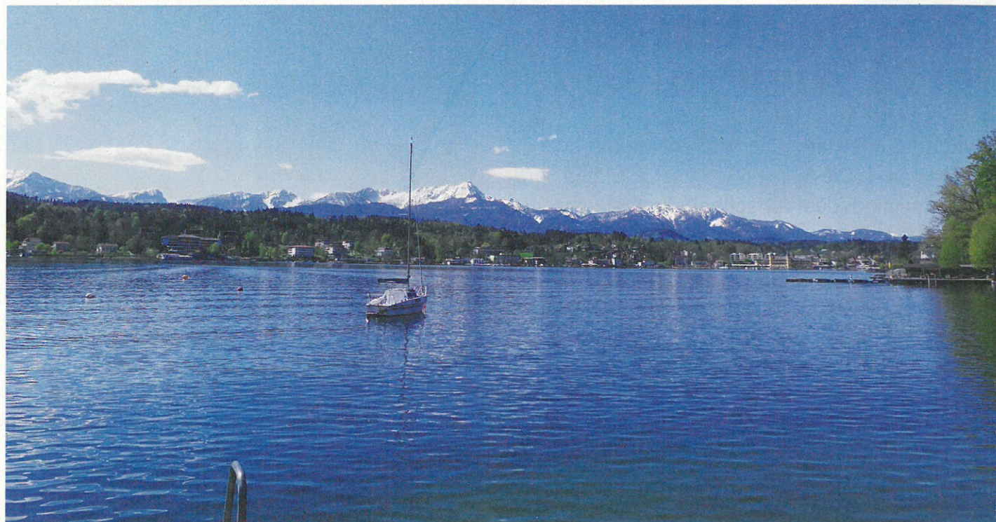
Diskretion ist bei Seeliegenschaften das A und O. Der Wertzuwachs bei Wörthersee-Immobilien ist ungebrochen